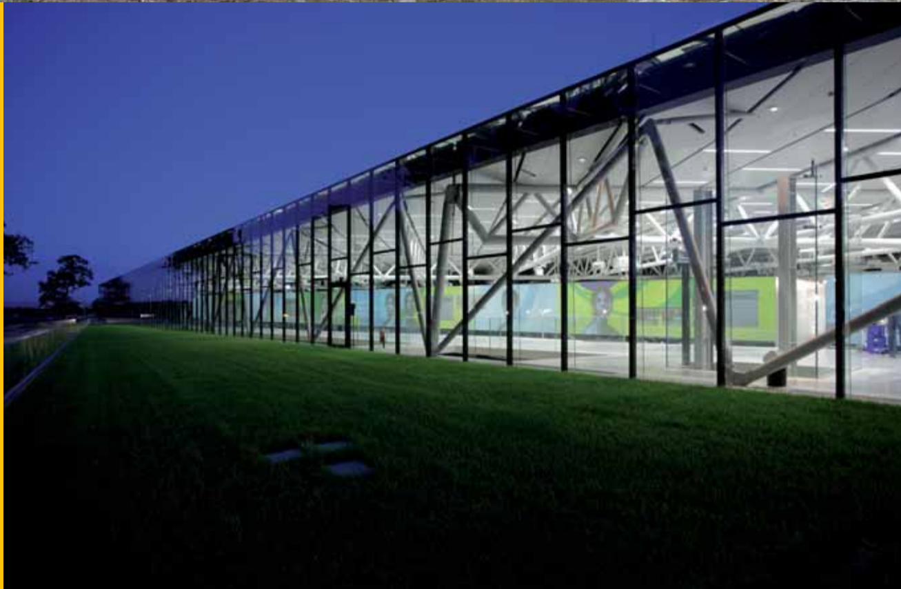
querkraft Adidas Brand Center, Deutschland, 2006