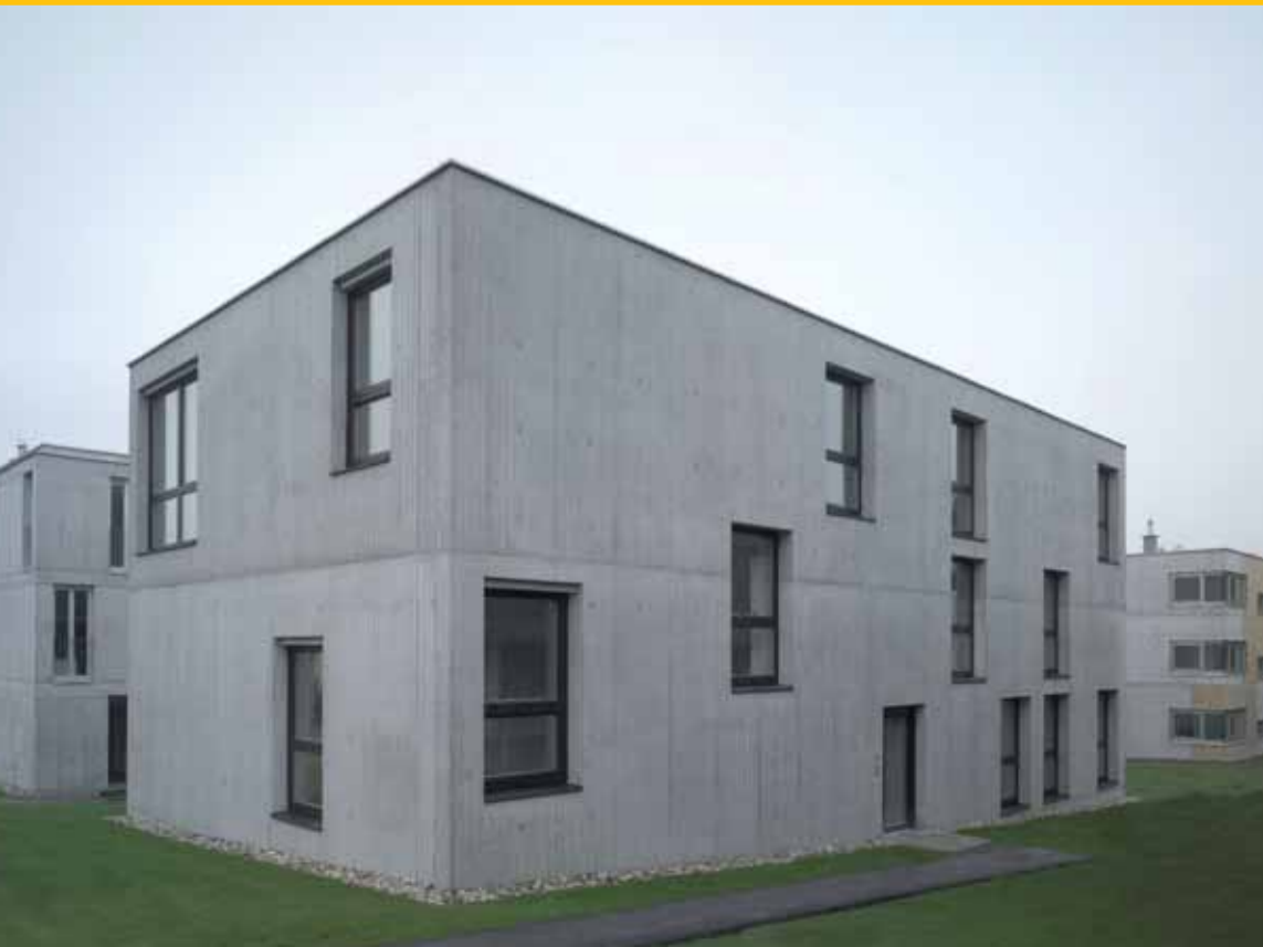
Mustersiedlung 9=12, Betonmodell, Wien, 2007