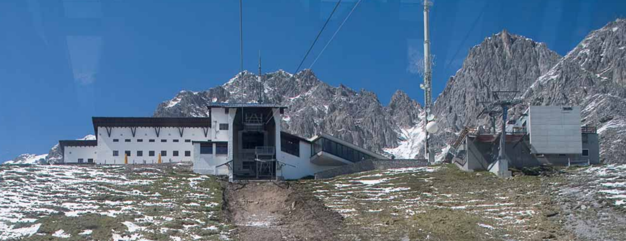
Franz Baumann | Schlögl & Süß Architekten Station Seegrube der Nordkettenbahn, Innsbruck, 1928 | 2006