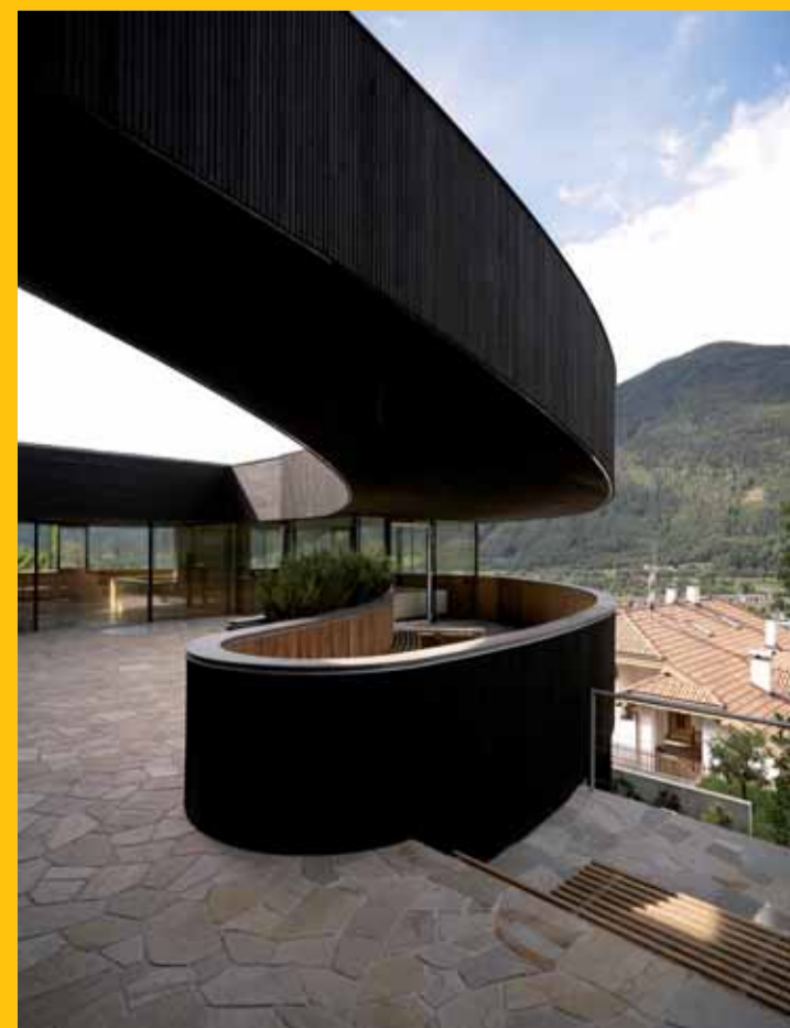
PAUHOF Architekten Haus D bei Brixen, Italien, 2007