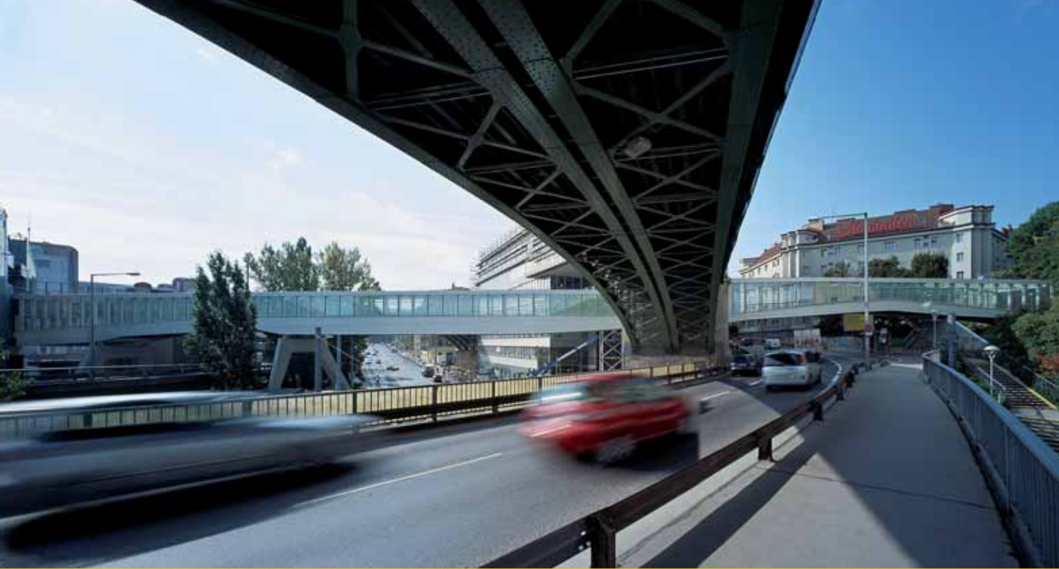
Generalplanung: Bulant & Wailzer | Wagner | Fritsch Skywalk Spittelau, Wien, 2007