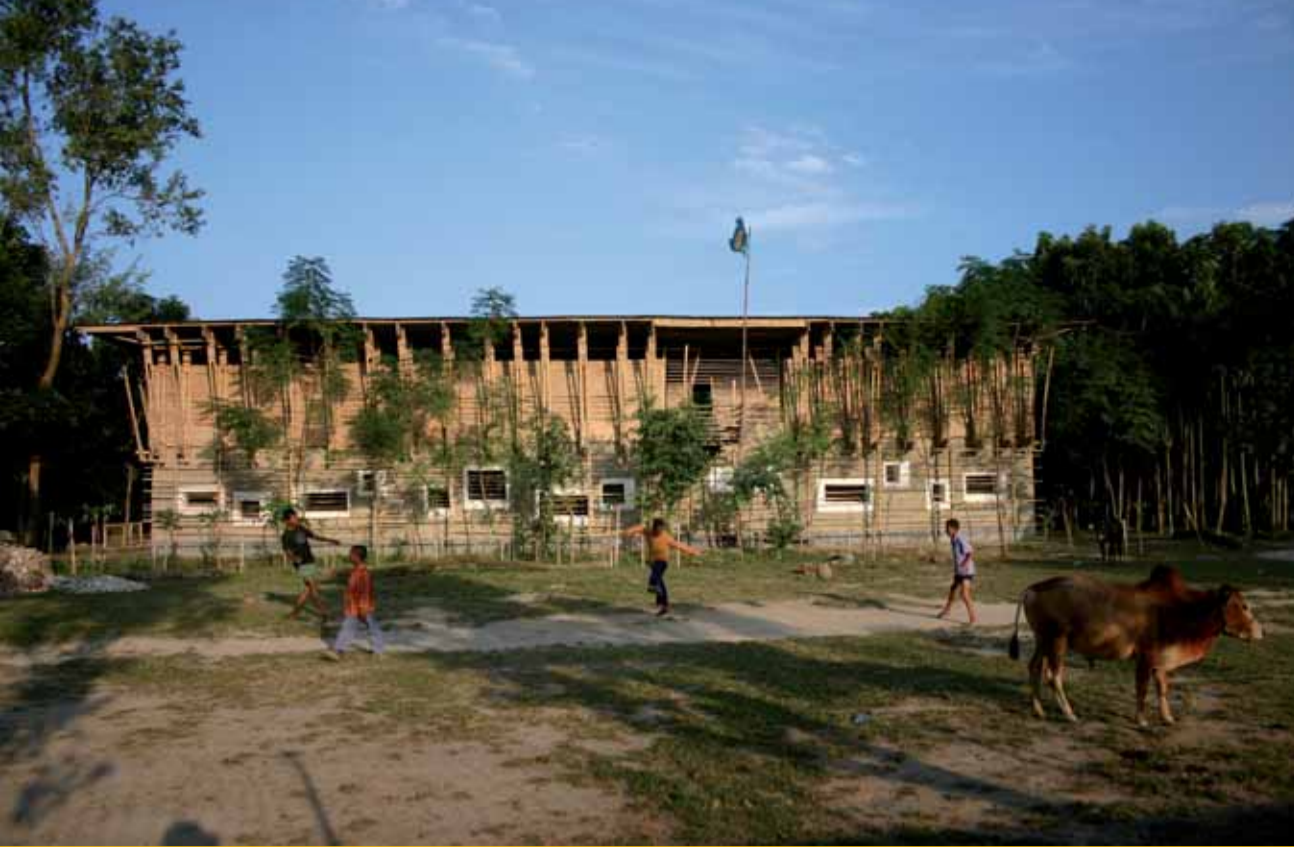
Anna Heringer | Eike Roswag Handmade School in Rudrapur, Bangladesch, 2006

man vor wenigen Jahren das Besucherzentrum Mauthausen fertig. Der minimalistische Architekturansatz, der mit reinen, oft sehr großen Sichtbetonflächen operiert, und der konzeptionelle Ansatz, der den Neubau weitgehend im Hang verschwinden lässt, führen hier einen Dialog mit einem besonderen Ort. Parallel zu diesem Neubau realisierte das Team MSPH Architekten das Besucherzentrum Gusen in der Nähe von Mauthausen. Dieses ehemalige Konzentrationslager ist zu Unrecht wenig bekannt; bereits Ende der 60er-Jahre wurde hier von der bekannten Mailänder Architektengruppe BBPR ein Memorial errichtet. Das neue Besucherzentrum ist kleiner und intimer als das benachbarte. Man könnte auch sagen, es ist architektonisch „dichter“, weil es einen Dialog mit dem vorhandenen Mahnmal führt.