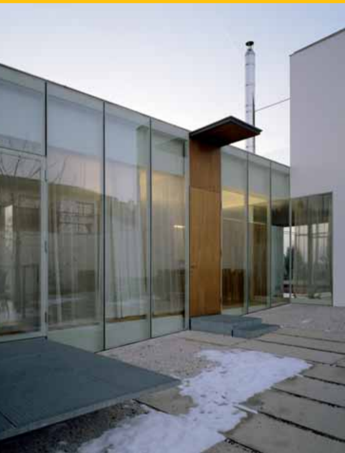
lichtblau.wagner architekten Hof.Haus, Steiermark, 2007