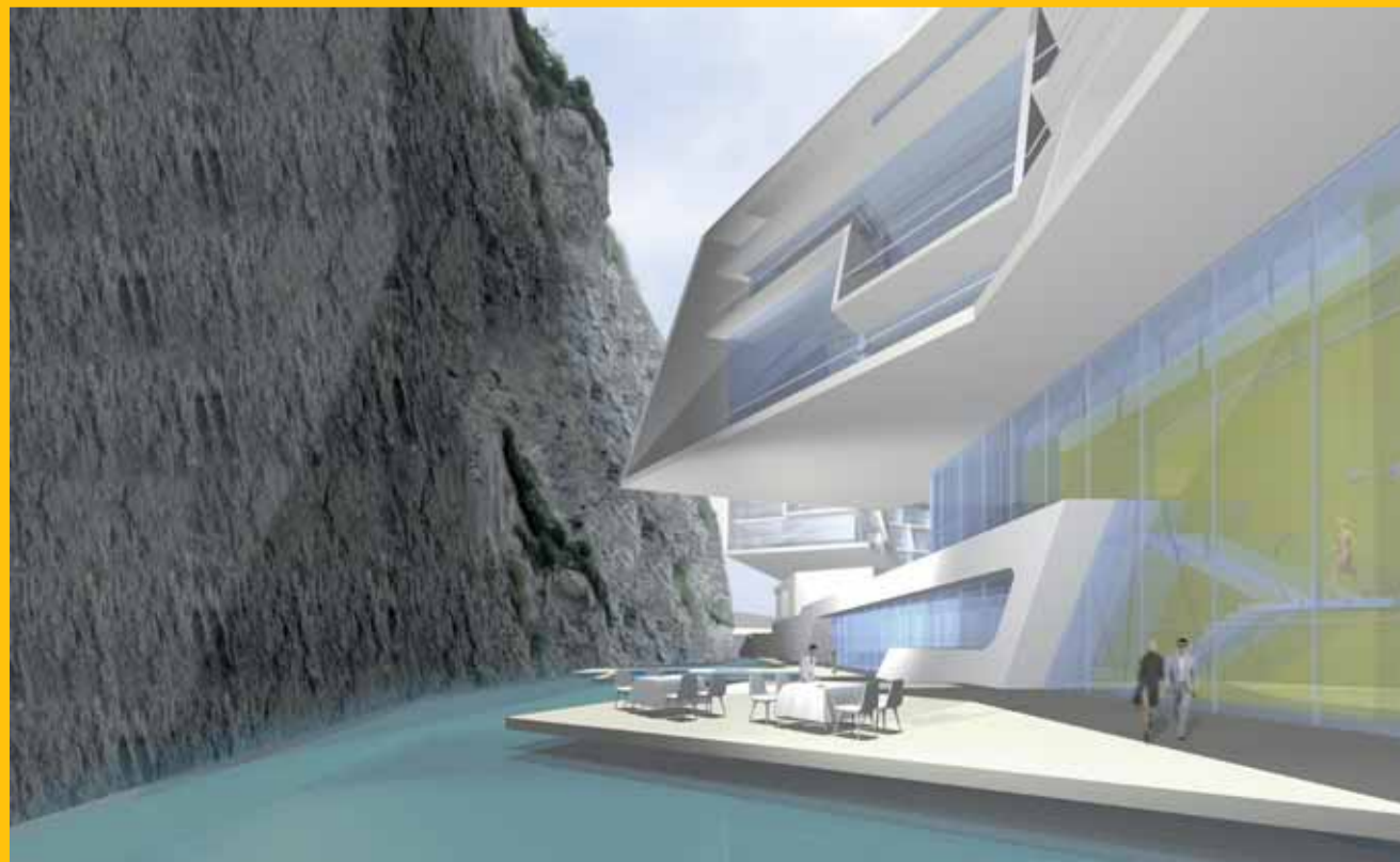
Hariri & Hariri – Architecture Wettbewerb Sternbrauerei, Salzburg, 2006 | Fertigstellung 2009 | 2010 Rendering: Hariri & Hariri – Architecture

Von Infrastrukturbauten zu dem zentralen politischen Thema des vorigen Jahrhunderts: Besichtigt man heute das ehemalige Konzentrationslager Mauthausen, so ist man nicht nur mit einem Ort des grauenhaften Verbrechens konfrontiert, sondern auch mit einem, der eine eigene Ästhetik in sich birgt. Architektonische Themen erhalten einen besonderen Stellenwert, denn diese sind – mehr als sonst – mit Bedeutung verknüpft. Dies trifft auf die historischen, aber auch auf die neuen Bauten zu. Für eine zeitgemäße Praxis des Erinnerns stellte