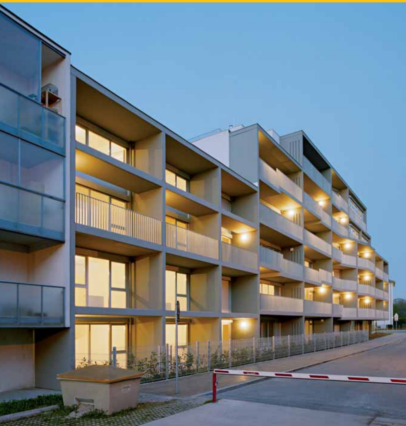
pool Architektur Wohnbau Oberdorfstraße, Wien, 2007